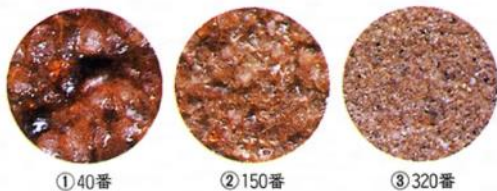
紙やすり表面の拡大図

球顆流紋岩 には ビー玉 くらいの大きさのかたい 球 が含まれているため、でこぼこしています。このでこぼこが、まるで紙やすりのような働きをするので、かたい金鉱石を小さく砕くことに役立ちました。