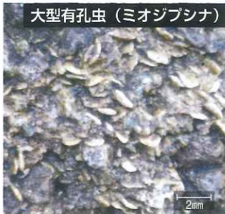
大型有孔虫 (ミオジブシナ)

誕生したての日本海は、浅くて暖かい海でした。この地層に見られる化石は、南の島に見られる星の砂 (大型有孔虫の一種) の仲間です。