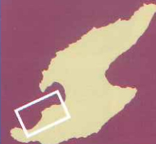
西三川・砂金山エリア