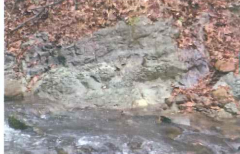
虎丸山の麓に見られる日本海誕生時の地層(左)と砂金(右)