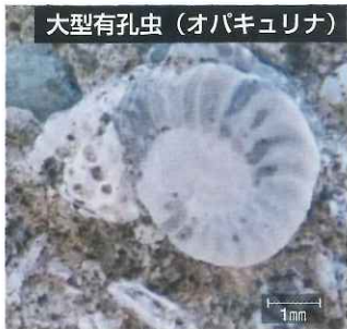
大型有孔虫 (オパキュリナ)