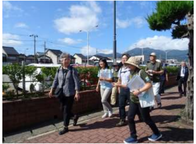
ジオパークガイドによる両津港周辺案内