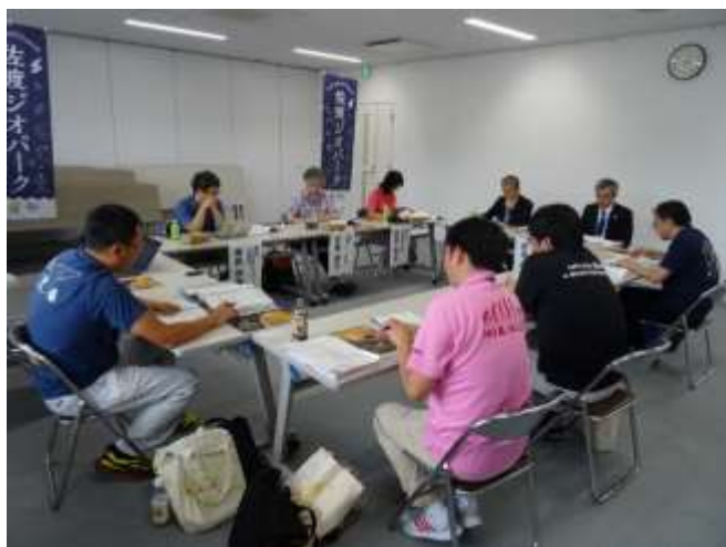
3つの取組に関する関係者ヒヤリング