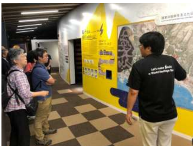
きらりうむ佐渡視察