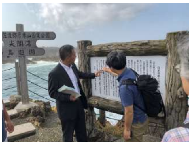
尖閣湾揚島遊園職員による説明