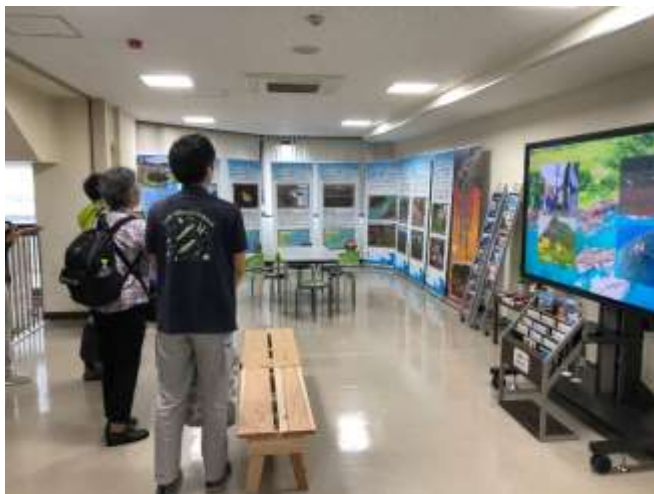
佐渡島離島開発総合センター2階ロビー