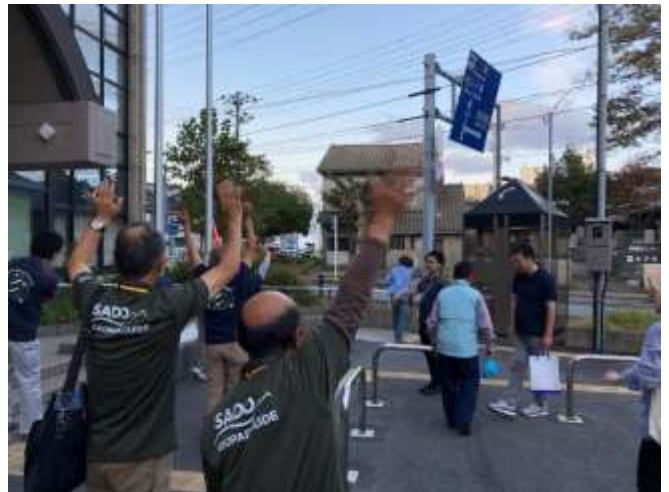
審査員を乗せた車が見えなくなるまでお見送り