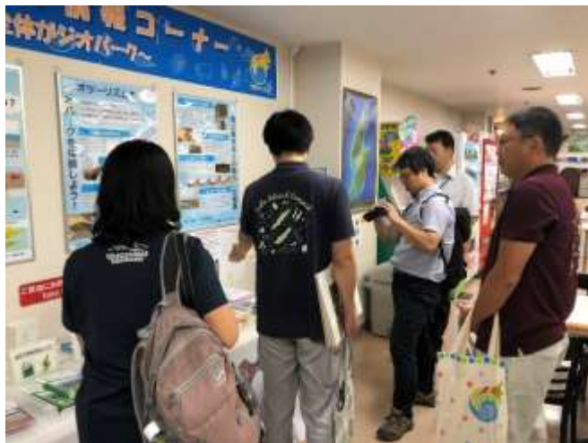
両津港内佐渡ジオパーク情報コーナー