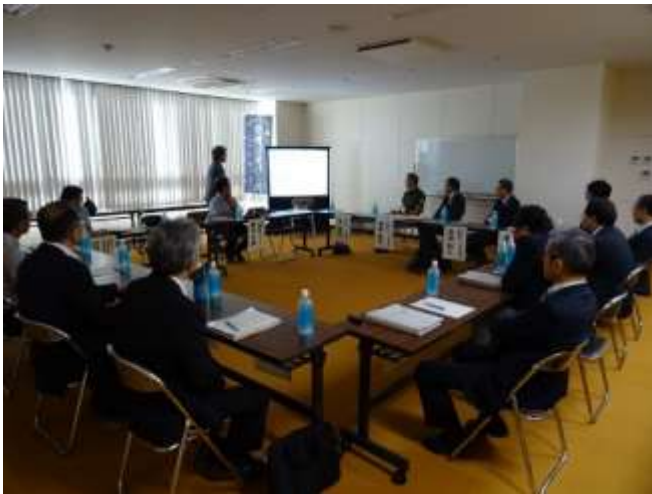
協議会運営委員との意見交換会