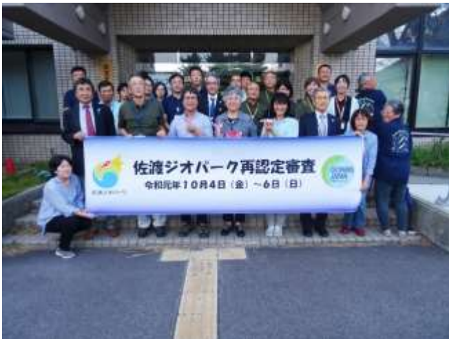
みんなで審査員をお見送り